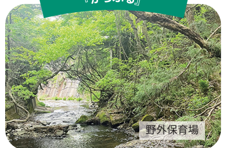
YMCAめぐみのもり『からふる』

子どもたちにとって安心できる場所、かけがえのない場所になるように子どもたちによりそって教育・保育をしていきます。チームで行いますので初めての方でも安心して働けます。子どもたちの命を守り、発達を促し、生き抜く力を育てていく、かけがえのない仕事です。また子どもの成長とともに保育者自身も成長できる場所がYMCAにはあります。