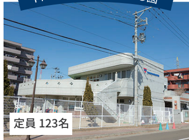
YMCA南大野田こども園