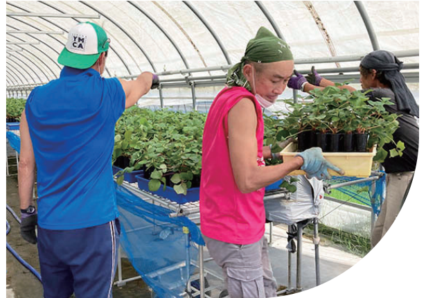
国際・地域協力募金