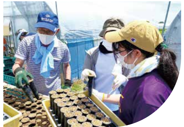
東日本大震災支援対策室