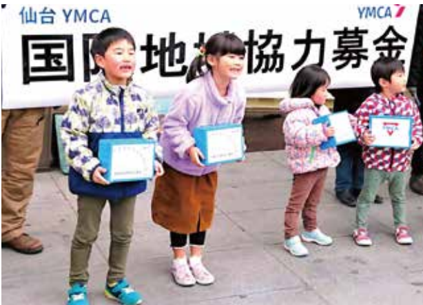
国際・地域協力募金

Positive Netとは互いの存在や個性を認め合い、高め合うことのできる、善意や前向きな気持ちによって繋がるネットワークのことです。課題の多い社会の中で、それが生きるためのひとつの選択肢となっています。私たち仙台YMCAはネットワークを活かしてPositive Netを広げ、希望ある・より豊かな社会を創ることを皆さまと共に目指します。